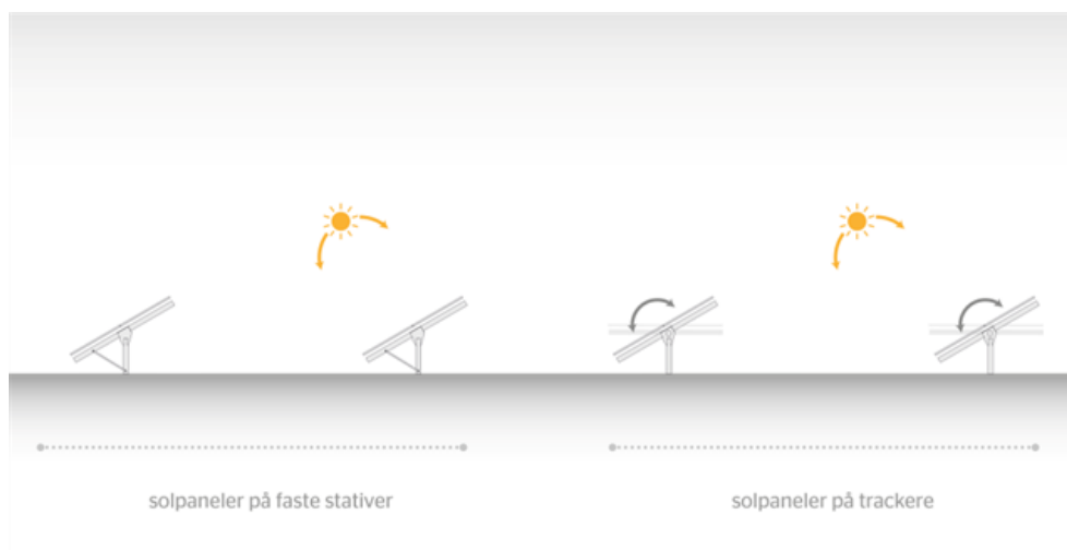
Figur 2. Illustration, der viser hhv. solpaneler monteret på faste stativer og stativer der kan vippe efter solens bevægelse. Systemet med trackere opstilles i rækker

Anlægget forventes at blive indhegnet af et trådhegn, alternativt virtuelt hegn, i planlægningen vil der blive stillet krav om at ydersiden af trådhegnet afskærmes af beplantningsbælter, som udgangspunkt med 3-5 rækker af træer og buske bestående af hjemmehørende stedsegrønne og løvfældende arter.