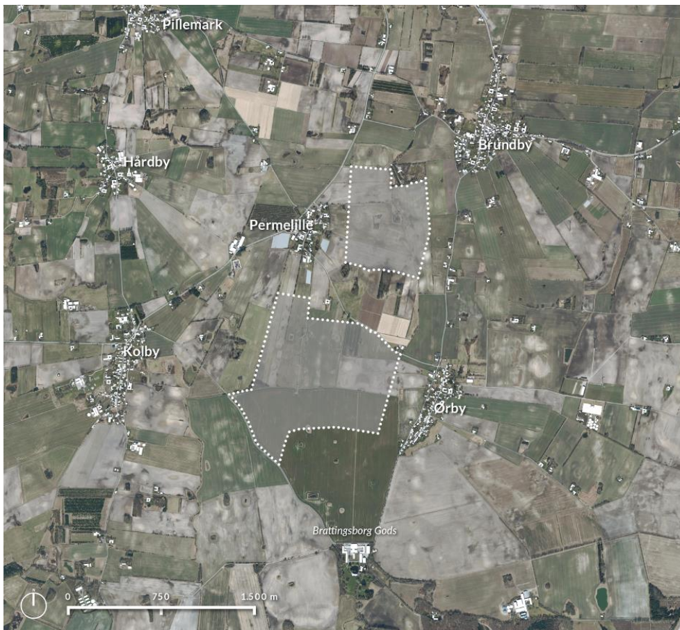
Figur 1. Placering af solcellepark. Med hvid prikket linje ses afgrænsningen af plan- og projektområdet. Det endelige layout vil blive fastlagt i forbindelse med udarbejdelse af lokalplanforslaget.